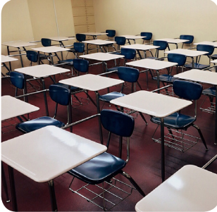
a. lunedì pomeriggio

C. Cosa farà Ruden la prossima settimana?