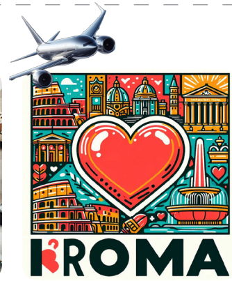
d. domenica sera