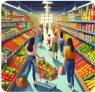
a. sabato mattina