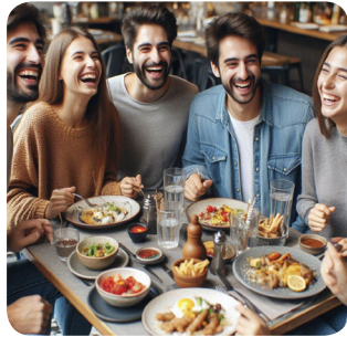
b. sabato sera