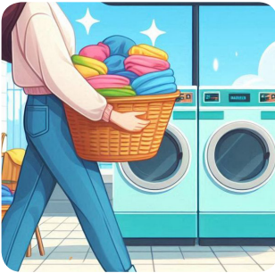
a. martedì mattina

D. Cosa farà Dana la prossima settimana?