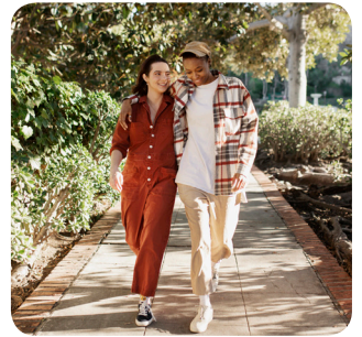
d. sabato pomeriggio