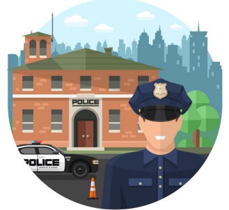
d. venerdì pomeriggio