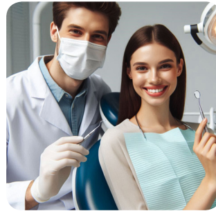
c. venerdì mattina