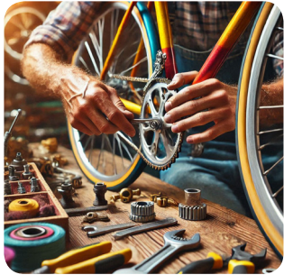
a. sabato mattina