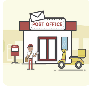
c. giovedì mattina