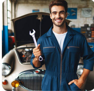
b. mercoledì pomeriggio