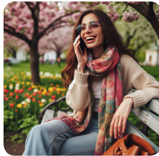
c. domenica mattina