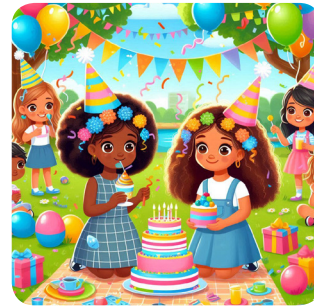
d. domenica pomeriggio