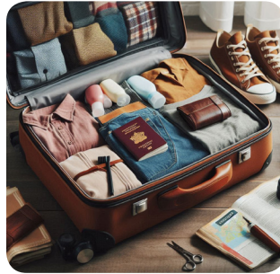
c. domenica pomeriggio