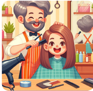
b. giovedì pomeriggio