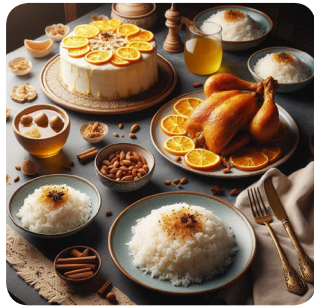
b. sabato pomeriggio